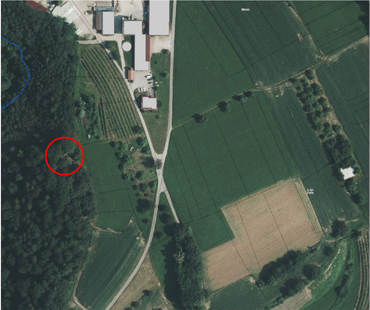
Grillplatz „Schöne Aussicht“ Hemmenhofen