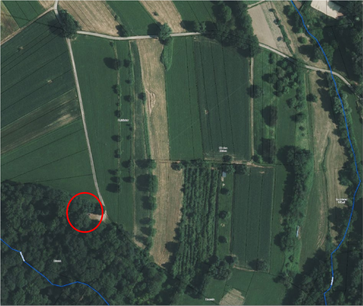
Grillplatz „Erlenloh“ Gaienhofen